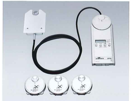
写真は組合せの一例です。(オプション品含む)

新たに 300-400nm 域の広帯域の測定が可能受光器を追加 (2016 年秋発売予定)