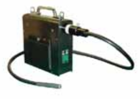
『発見伝Ⅱ』 + ストレートライトガイド