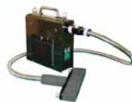
『発見伝Ⅰ』 + フラットライトガイド